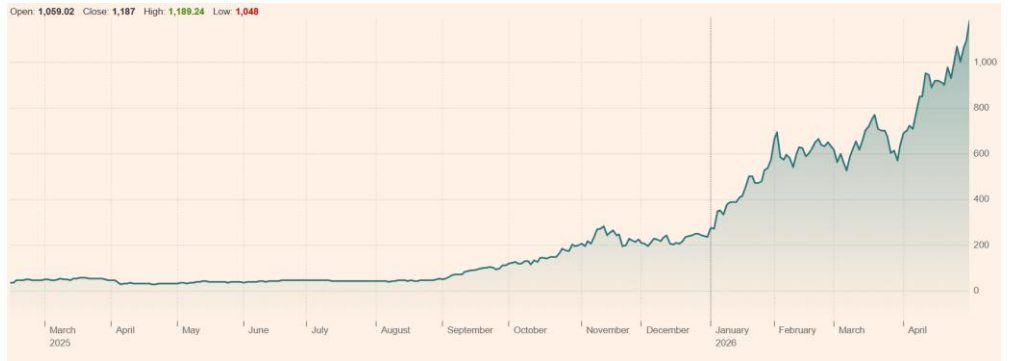
Sandisk Corp (SNDK:NSQ) 상장 후 주가 흐름