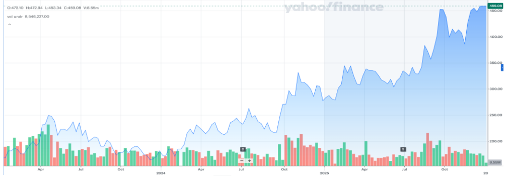
NAURA Technology Group Co., Ltd. (002371.SZ) 최근 3년 주가 흐름