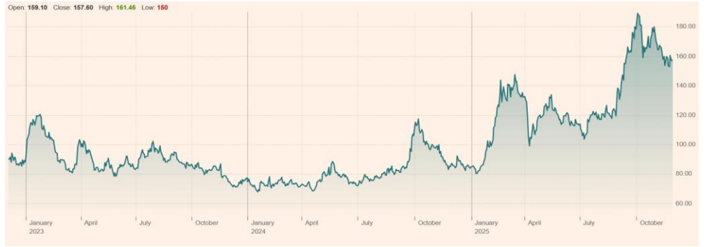
Alibaba Group Holding Ltd (BABA:NYQ) 최근 3년 주가 흐름