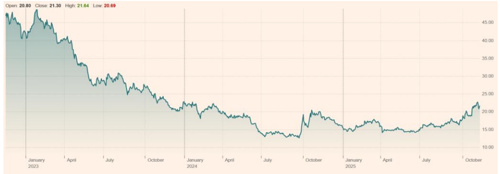
LONGi Green Energy Technology Co Ltd (601012:SHH) 최근 3년 주가 흐름

LONGi Green Energy 주가 +39.27% YTD 시가총액 33.9조원