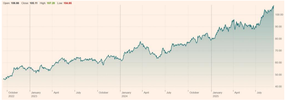
O'Reilly Automotive Inc (ORLY:NSQ) 최근 3년 주가 흐름

O'Reilly Automotive 주가 +43.98% 1Y 시가총액 127조원