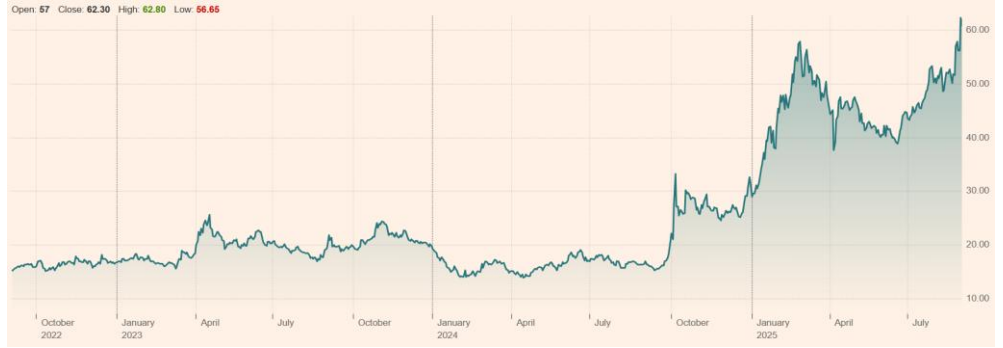
Semiconductor Manufacturing International Corp (0981:HKG) 최근 3년 주가 흐름