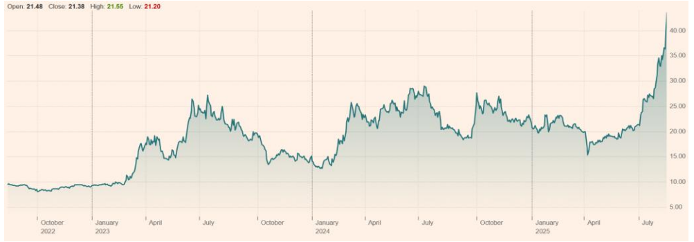
Foxconn Industrial Internet Co Ltd (601138:SHH) 최근 3년 주가 흐름