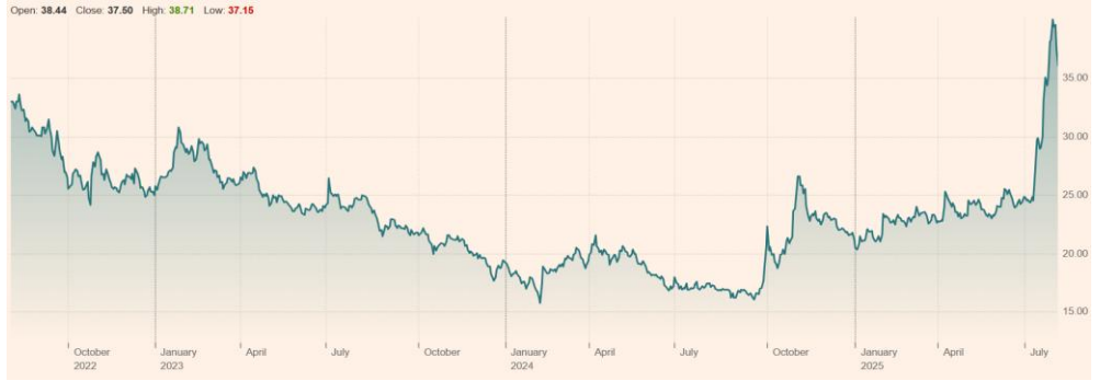
China Northern Rare Earth Group (600111:SHH) 최근 3년 주가 흐름