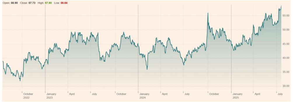
Jiangsu Hengrui Pharmaceuticals Co Ltd (600276:SHH) 최근 3년 주가 흐름