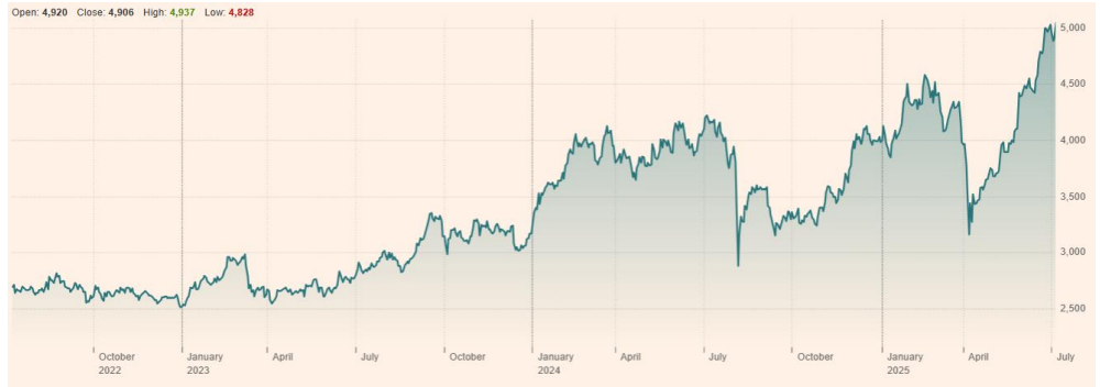
SBI Holdings Inc (8473:TYO) 최근 3년 주가 흐름