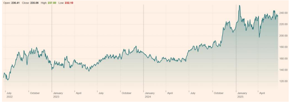
Cheniere Energy Inc (LNG:NYQ) 최근 3년 주가 흐름

Cheniere Energy 주가 +43.32% 1Y 시가총액 71.6조원