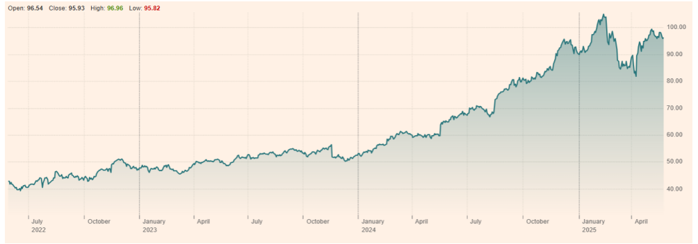
Walmart Inc (WMT:NYQ) 최근 3년 주가 흐름