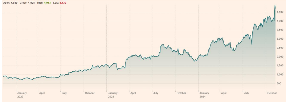
Sanrio Co Ltd (8136:TYO) 최근 3년 주가 흐름