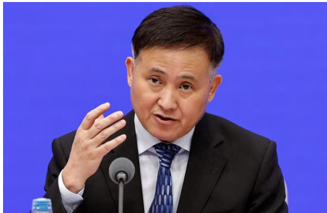
판공성(潘功胜) 중국인민은행 총재

지난 24일 중국 정부는 예상 밖의 부양책을 발표했습니다. 국무원은 기자회견을 열어 지급준비율(RRR) 50bp 인하, 주택 모기지 금리 50bp 인하 등 추가적인 유동성 공급 계획을 밝혔습니다. 또한 자본시장을 지원하기 위한 새로운 정책도 공개했습니다. 증권사, 운용사, 보험사가 보유하고 있는 채권, 주식형 ETF, CSI300 구성 종목 등 자산을 담보