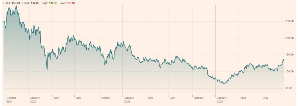
Meituan (3690:HKG) 최근 3년 주가 흐름