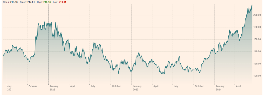
Qualcomm Inc (QCOM:NSQ) 최근 3년 주가 흐름