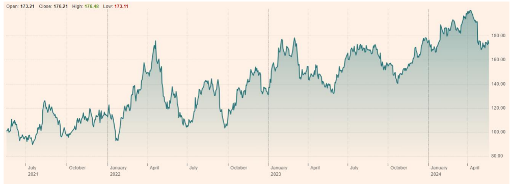
Nucor Corp (NUE:NYQ) 최근 3년 주가 흐름