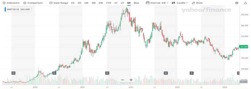
Contemporary Amperex Technology Co., Limited (300750:SZ) 최근 5년 주가 흐름