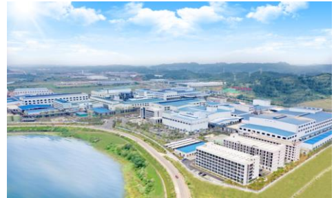
출처: 호남운능 웹사이트

중국의 배터리용 양극재 제조기업 Hunan Yuneng(호남운능) 이 2023년 2월 9일 심천 차이넥스트 시장에 상장되었습니다. 공모가는 23.77위안이었으며, 현재가는 +95% 상승하여 46.53위안이 되었습니다. 시가총액은 6.6조원 규모입니다. 원화 기준 공모금액은 8천억원 수준으로, 현재 집중하고 있는 리튬인산철(LFP) 양극재 생산을 확대하는데 투자될 계획입니다. 전기차 시장이 성장함에 따라 양극재 시장의 가파른 성장이 예상되고 있습니다.