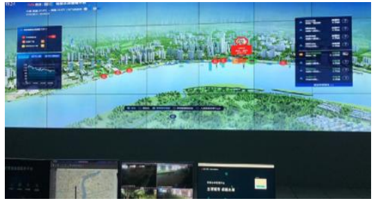
스마트 시티 - 상하이 West Bund 프로젝트

2021년 상반기 기준으로 사업부문은 스마트 비즈니스와 스마트 시티로 구분됩니다. 두 부분의 매출이 전체의 85% 이상을 차지합니다. 스마트 비즈니스 는 수 천개의 AI 모델을 기반으로 다양한 기업들에게 맞춤형 AI 인프라를 구축해 주는 사업입니다. 직원 관리, 사내 통신설비, 내부 SW 등 모든 서비스를 지원하며 기업의 워크 플로우를 처음부터 끝까지 관리할 수 있는 서비스입니다. 2020년까지는 스마트 비즈니스가 가장 컸고, 여전히 주요한 서비스이나 2021년 상반기를 기점으로 스마트 시티가 가장 큰 비중을 차지하게 되었습니다(매출의 48%). 스마트 시티 는 도시 전체의 AI 기반을 구축하고 관리해주는 종합 서비스인데 현재 119개의 중국 도시와 연계되어 있습니다. 향후 성장에서 가장 주목해야 할 포인트라고 할 수 있습니다. 도시 보안을 위한 CCTV를 설치하고 교통체증, 사고 감지, 파킹, 무단횡단을 감시할 수 있는 AI 인프라를 구축하는 것인데, 중국정부가 추진하는 핵심사업의 일환이기 때문에 주목됩니다. 2020년에는 상하이 메트로와 제휴해 세계 최초 AI 기반 지하철역을 만들기도 했는데 스마트 시티 건설에서 가장 앞서가는 기술을 증명해 준 프로젝트라고 할 수 있습니다.